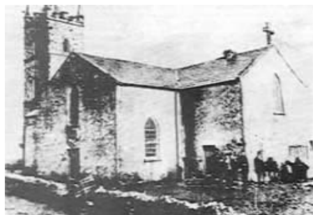
Miejsce objawienia kościół w Knock