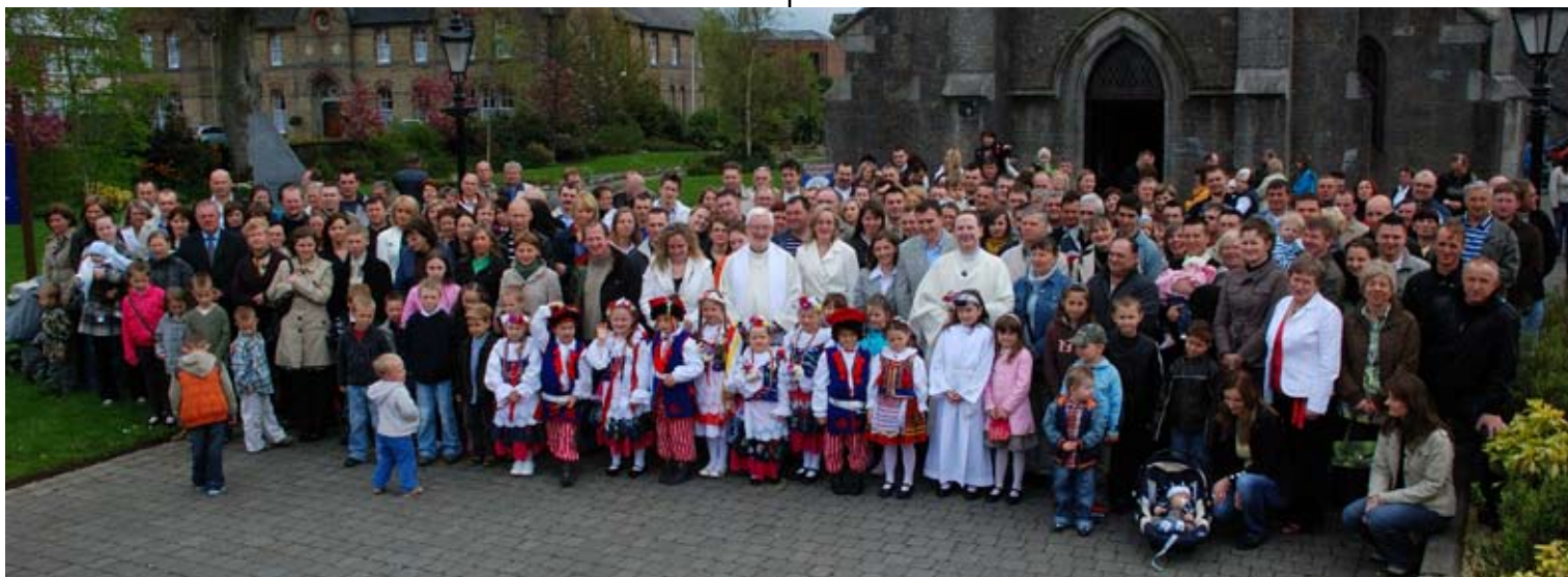
Polska Wspólnota w niedzielę poświęcenia Obrazu Jasnogórskiego przed kościołem parafialnym św Conletha w Newbridge

The Newbridge Polish community in the Diocese of Kildare and Leighlin present this painting of Our Lady of Czestochowa to St. Conleth's Church on 26 April 2009.