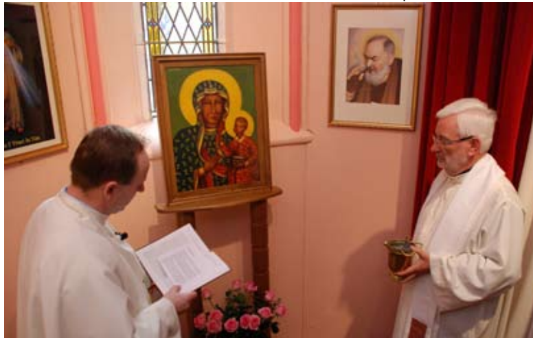
Poświęcenie Jasnogórskiego Obrazu w Newbridge

Wyjeżdżając do Irlandii pakowaliśmy to co było małe i mieściło się w naszym bagażu, resztę zabieraliśmy w sercu. Przyszedł wreszcie czas aby „ucieleśnić” nasze pragnienia i Matkę Bożą Częstochowską, którą zawsze nosimy w sercu jako Polacy umieścić w Jej Cudownym Obrazie w kościele, w którym zawsze tak licznie się gromadzimy.