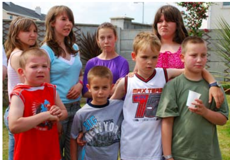
Dzieci z bielskiego domu dziecka spędzające wakacje w Irlandii

W połowie pobytu zostało zorganizowane wspólne spotkanie. Dwie rodziny udostępniły swoje domy a w przygotowaniu przyjęcia pomogli wszyscy. Przy grillu, dźwiękach gitary i śpiewach, dzieci mogły pobawić się na dmuchanym zamku a przede wszystkim mogły się wspólnie spotkać i podzielić nowymi wrażeniami. Miłą niespodzianką było dla nas to, że nasi znajomi nie związani z akcją